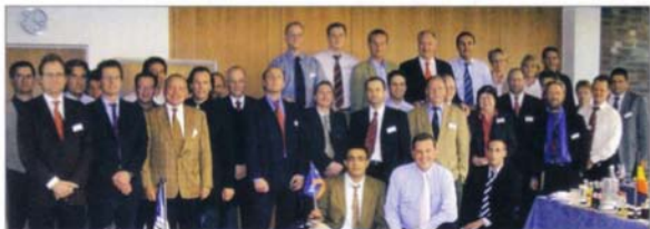
Und das ist die europäische Führungsmannschaft der Firmengruppe auf der letzten Tagung.