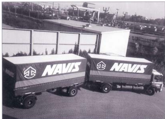
Auch ein Bild aus „alten Tagen“. Ein LKW für unsere europäischen Landverkehre vor unserem Terminal in Hamburg.